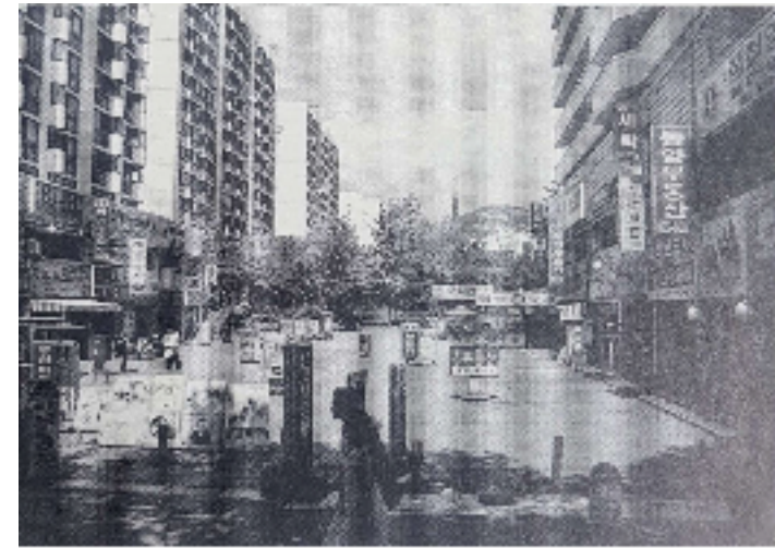
주거 단지에 접한 주변 가로 공간의 생활 공간화, 상계 신 시가지