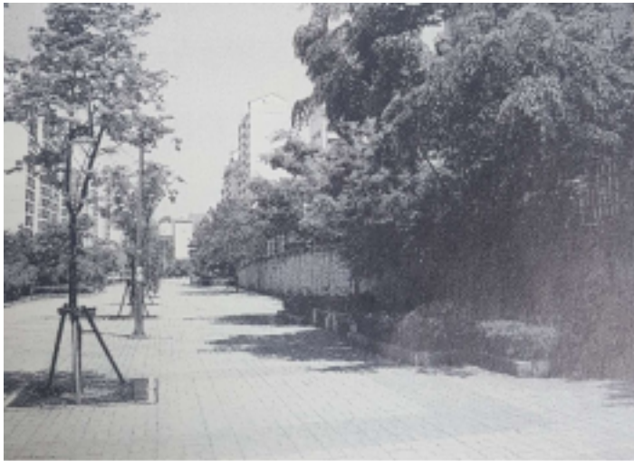
담장으로 단절된 주거단지와 주변 가로, 분당 신도시